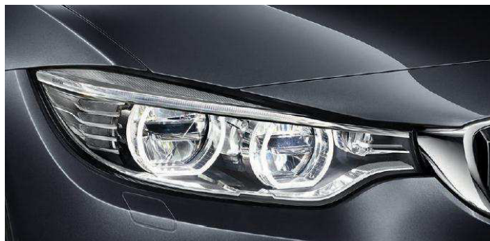
Faros LED autoadaptables. Incluyen luces de día, luces de cruce y de carretera, asistente de luz de carretera antideslumbrante, faros antiniebla LED, luz lateral, intermitentes, alumbrado diurno y luces autoadaptables con distribución variable de la luz para una perfecta iluminación del camino y una mejor visibilidad por la noche. Opcional en todas las versiones.