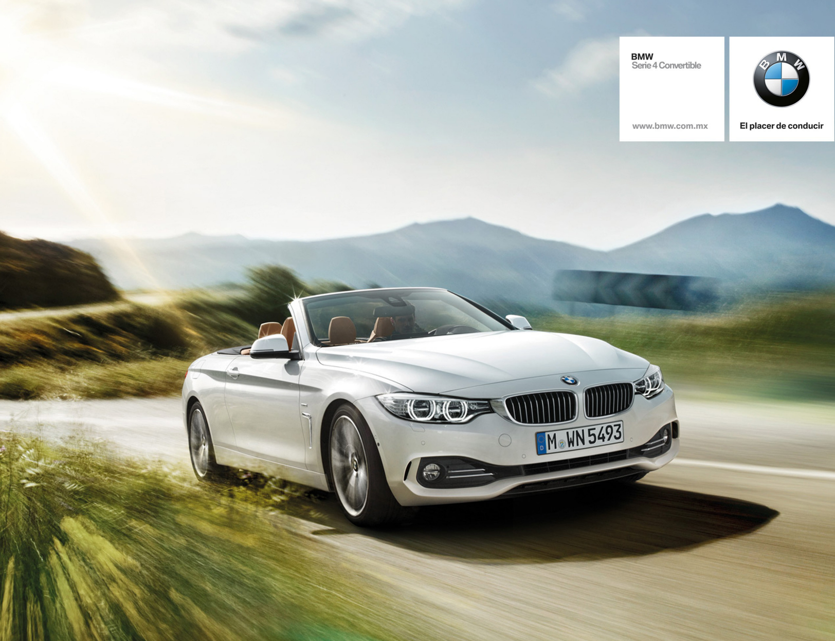
Imagen únicamente ilustrativa.