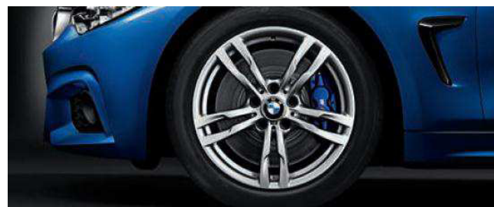
Rines con diseño de radios dobles estilo 441 M de 18". De serie en M Sport.

Frenos M Sport. Con freno de pinza en azul oscuro y símbolo M, dispone de discos más amplios y, por ello, de mayor fuerza de frenado. De serie en M Sport.