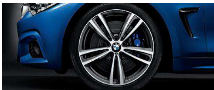
Rines con diseño de radios dobles estilo 442 M de 19". Opcional en M Sport.