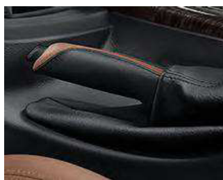
Empuñadura de freno de mano Luxury. Con elegante efecto gracias a la pieza central de cuero.