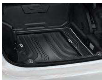
Alfombrilla para maletero. Antideslizante, de material sintético de gran resistencia y a la medida para el maletero.