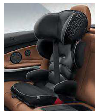
BMW Junior Seat 2/3. Disponible en dos colores.