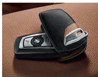
Estuche para llaves Luxury. Atractivo, de fino cuero. Disponibles en diferentes versiones.