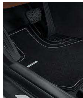
Alfombrillas textiles Luxury. Perfecto ajuste, repelentes a la suciedad y resistentes al agua. En la versión Luxury con alfombrillas en negro intenso y anagrama BMW en la inserción metálica.