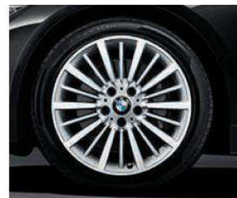
Rines con diseño de radios múltiples estilo 416 de 18". De serie en Luxury Line.