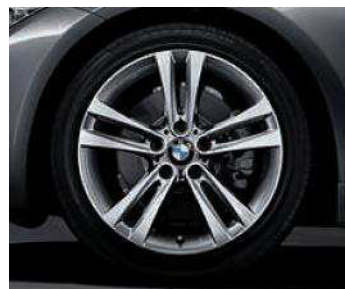
Rines con diseño de radios dobles estilo 397 de 18". De serie en Sport Line.