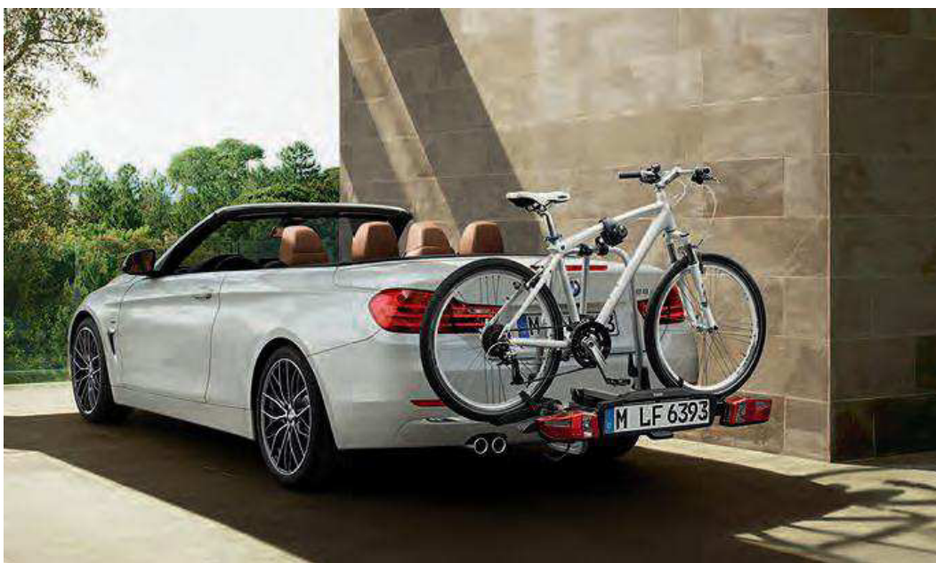
Rines con diseño de radios dobles estilo 405 M de 20", soporte de bicicletas para el enganche de remolque.